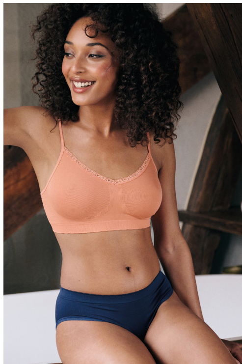
ZEN ATTITUDE - Maille tricotage circulaire. Brassière : 21 € le lot de 2 - Slip : 14,50 € le lot de 2

CONFORT, LÉGÈRETÉ & LIBERTÉ DE MOUVEMENTS.