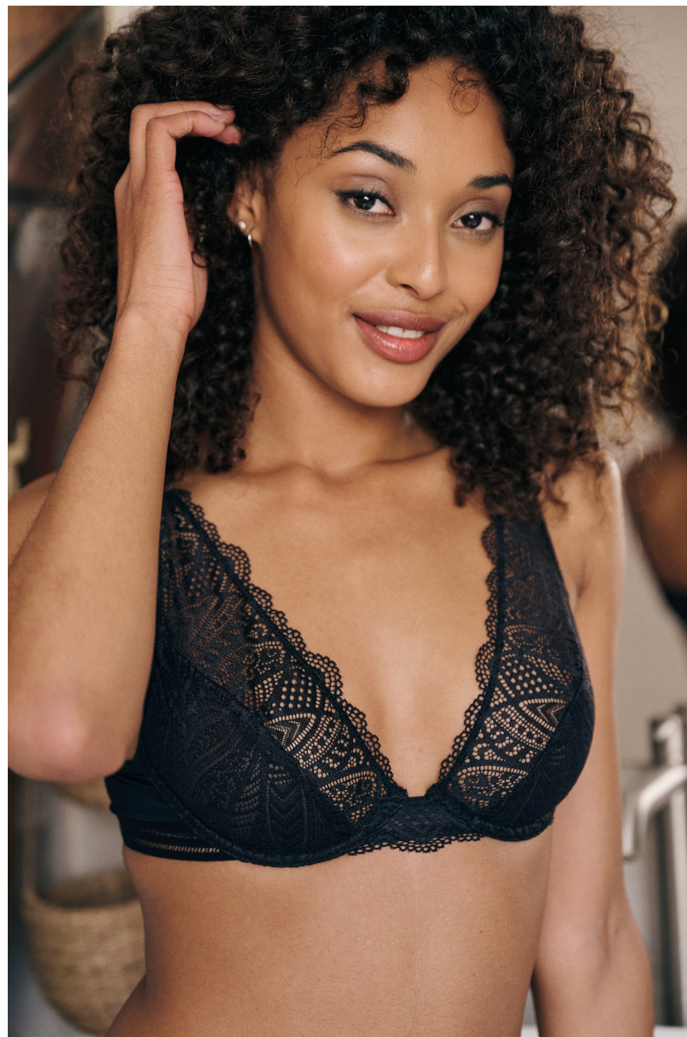
SUBLIME Dentelle ajourée et douce microfibre. SG armatures : 29 €